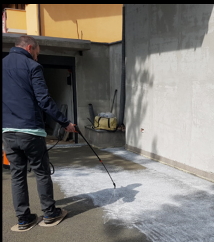
APPLICAZIONE SUL GETTO FRESCO