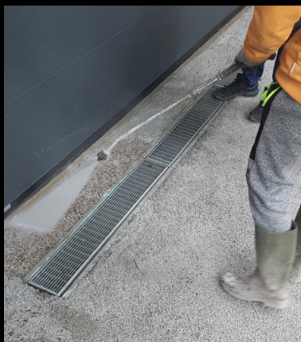
LAVAGGIO DOPO 24 ORE