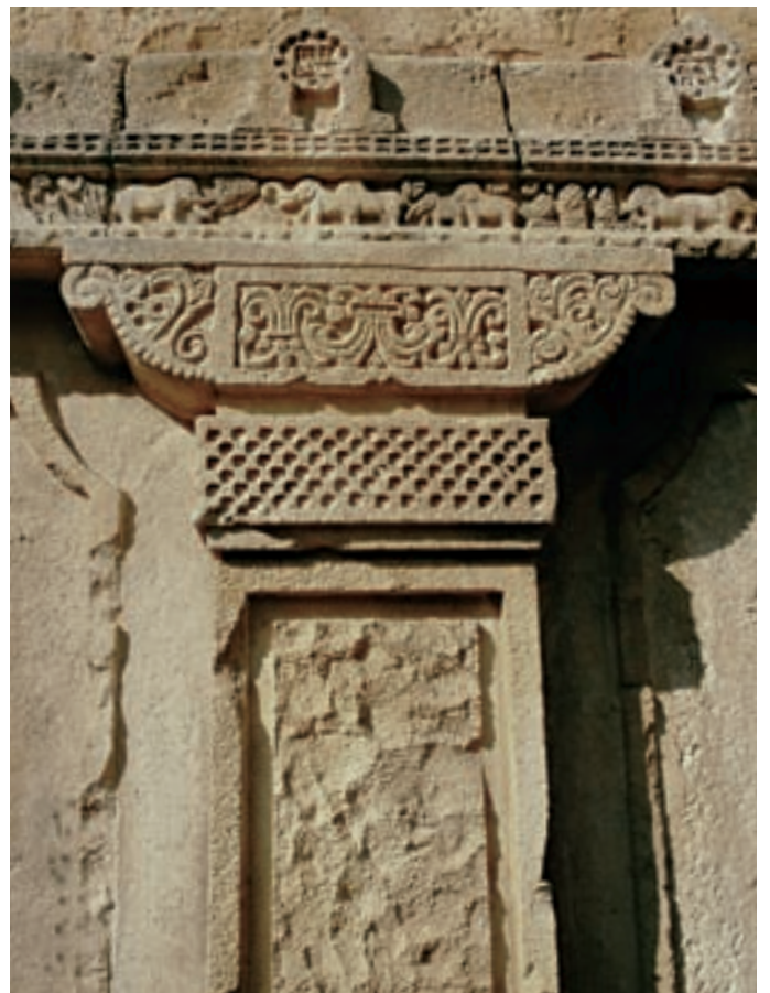
Elefantenhaus, Zoo Hannover Elephant's house, Zoo Hannover Pavillon de l'éléphant, Zoo d'Hanovre