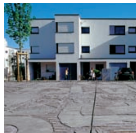
Spielplatz, Oberursel Playground, Oberursel Aire de jeux, Oberursel