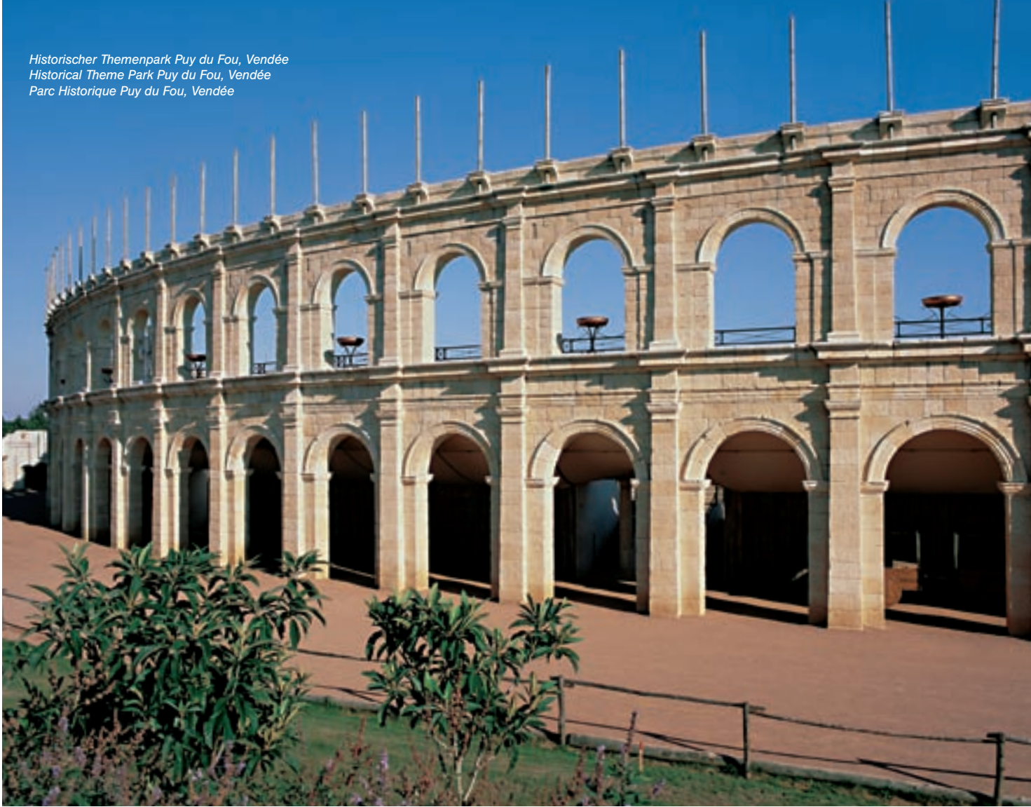
Historischer Themenpark Puy du Fou, Vendée Historical Theme Park Puy du Fou, Vendée Parc Historique Puy du Fou, Vendée