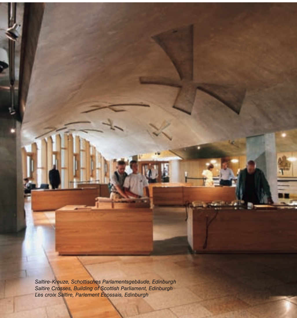
Saltire-Kreuze, Schottisches Parlamentsgebäude, Edinburgh Saltire Crosses, Building of Scottish Parliament, Edinburgh Les croix Saltire, Parlement Ecossais, Edinburgh

N'hésitez pas à nous demander notre documentation complète: album de références, catalogue des matrices standard, notices techniques et échantillons. Vous pouvez également visiter notre site internet www.soceco-reckli.com .