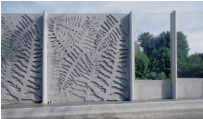
Ringautobahn A 47, St. Etienne Ring Highway A 47, St. Etienne Autoroute périphérique A 47, St. Etienne