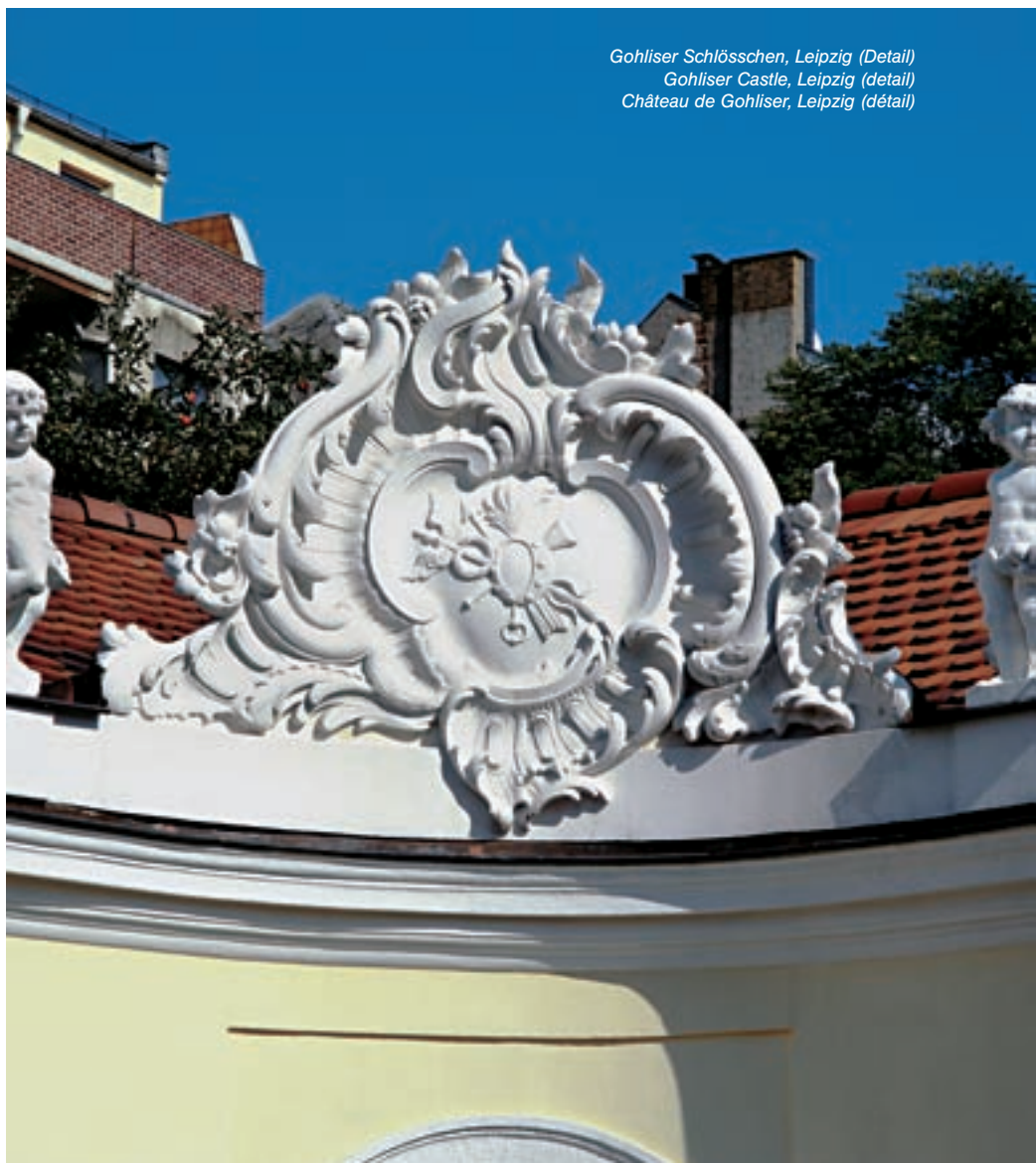
Gohliser Schlösschen, Leipzig (Detail) Gohliser Castle, Leipzig (detail) Château de Gohliser, Leipzig (détail)

Fordern Sie auch unser weiteres Informationsmaterial an: 64-seitige farbige Bilddokumentation, Standardstrukturkatalog mit Referenzobjekten, Materialmuster, technische Merkblätter oder besuchen Sie uns auf unserer Homepage www.reckli.de .