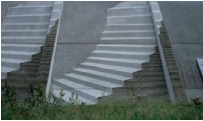
Schallschutzwand, Autobahn A 3, Ausfahrt Herford Noise barrier, Highway A 3, Exit Herford Mur anti-bruit, Autoroute A 3, Sortie Herford