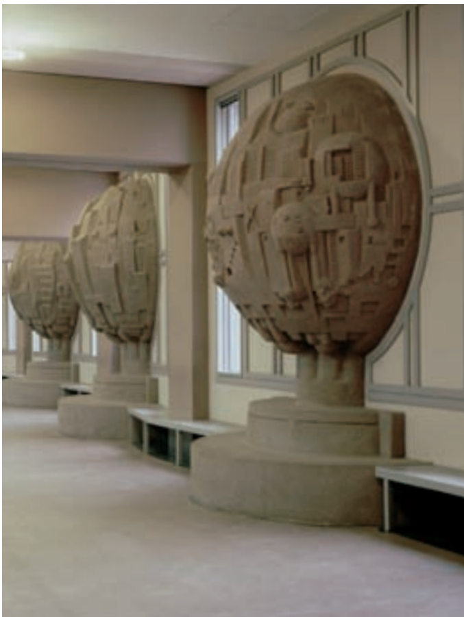
Universitätsbibliothek, Mannheim Library of University, Mannheim Bibliothèque universitaire, Mannheim