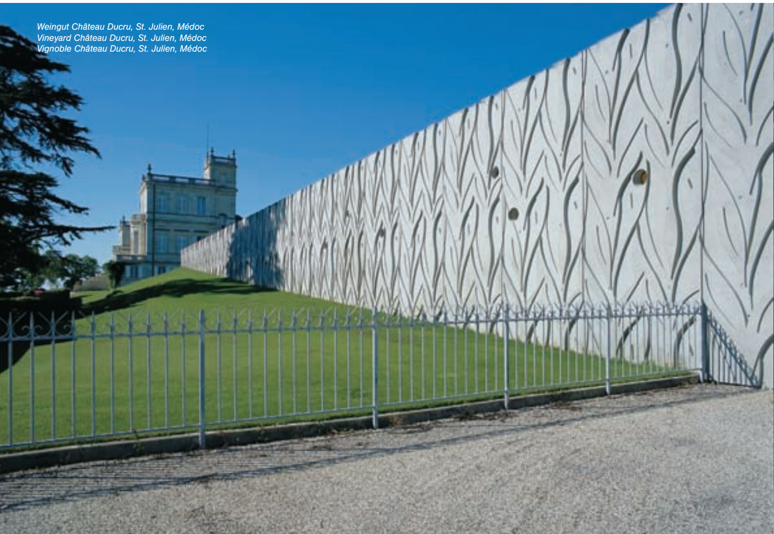
Weingut Château Ducru, St. Julien, Médoc Vineyard Château Ducru, St. Julien, Médoc Vignoble Château Ducru, St. Julien, Médoc