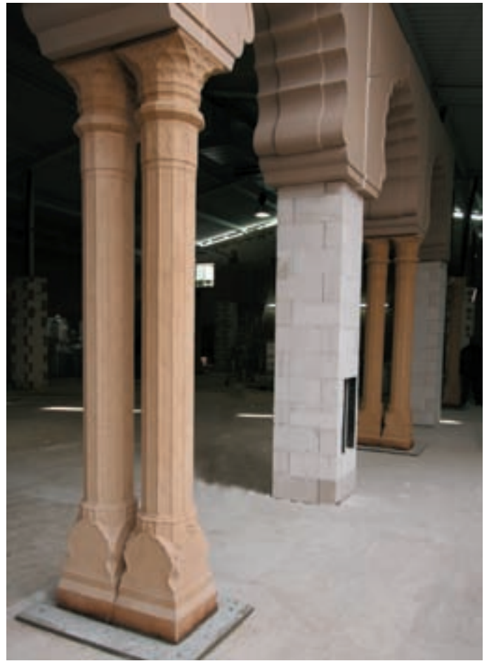
Säulen, Prunksaal, Zoo Hannover Columns, State Hall, Zoo Hannover Colonnes de la Grande Salle du Zoo d'Hanovre