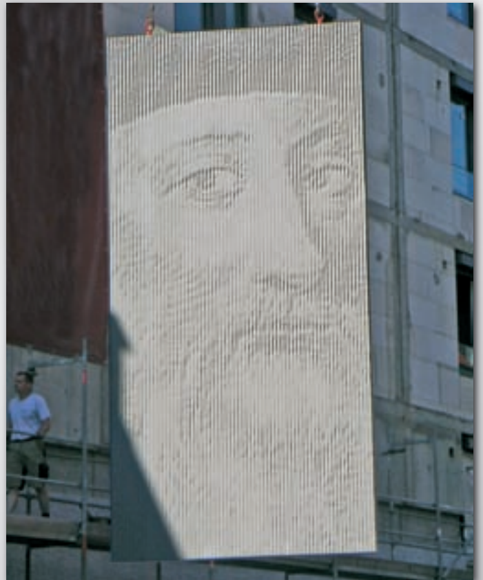
Betonelement für die „Gutenberghöfe“, Heidelberg Concrete panel for the „Gutenberghöfe“, Heidelberg Élément béton pour la „Gutenberghöfe“, Heidelberg